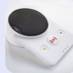
ÚSTŘEDNA S REPRODUKTOREM A MIKROFONEM