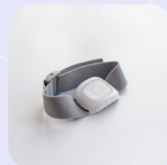
NÁRAMEK S VODOTĚSNÝM TÍŠŇOVÝM TLAČÍTKEM

Námi využívané zařízení je vyrobené a certifikované v EU speciálně pro službu tísňové péče.