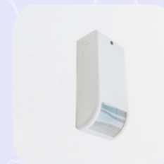
POHYBOVÉ ČIDLO PŘIPEVNĚNÉ NA ZDI

Celková měsíční platba za službu 780 Kč včetně pravidelného volání a servisu zařízení.